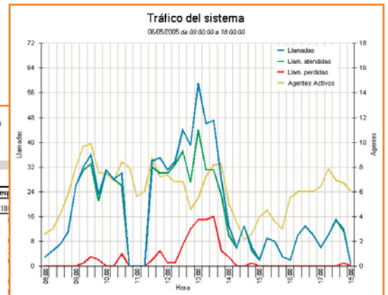
Permite adecuar el número de agentes al tráfico real

Configuración de Colas: Horarios, tratamiento de llamadas, umbrales, llamadas a atender, criterios de distribución a agentes, mensajes utilizados, URL asociadas, permisos de grabación, posibilidad de escape a buzón.